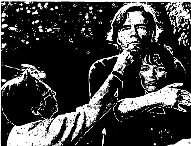
Marguerite Duras, Michel Lonsdale et Nicole Hiss pendant le tournage de « Détruire dit-elle ».

Rivette Je ne l'avais pas lu quand il est sorti, puis j'ai appris que vous faisiez le film, et du coup je n'ai pas voulu le lire avant d'avoir vu le film : parce que, quand on lit un livre, et qu'après on voit le film... j'avais peur de me faire mon propre cinéma dans ma tête, et je préférais voir le vôtre d'abord. Et j'ai lu le livre depuis : mais alors évidemment, presque comme si je lisais le scénario... Mais quand vous écriviez ces indications, il y avait l'idée de film à l'horizon ? Ou c'était simplement parce que vous ne